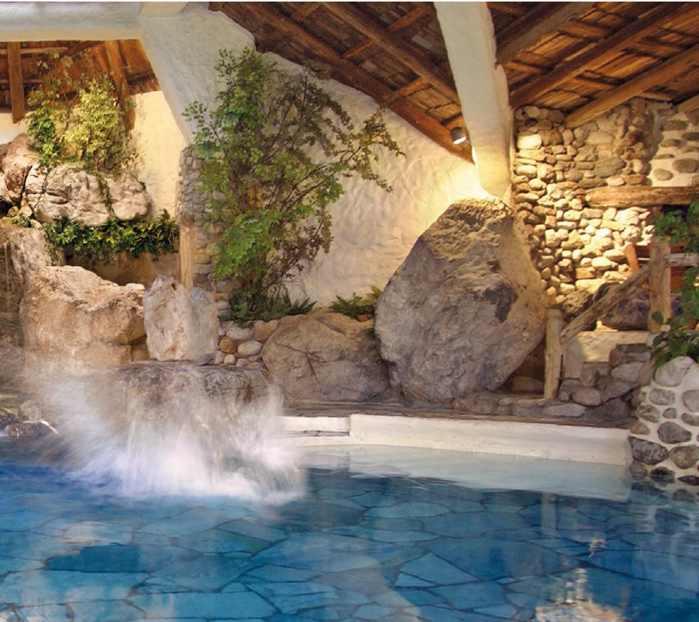
IM REICH DER SINNE