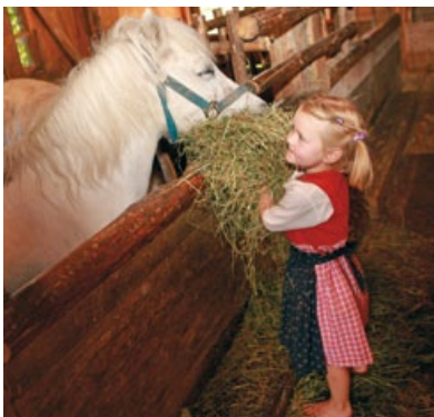
JOYFUL MOMENTS AT THE STANGLWIRT'S CHILDREN'S FARM