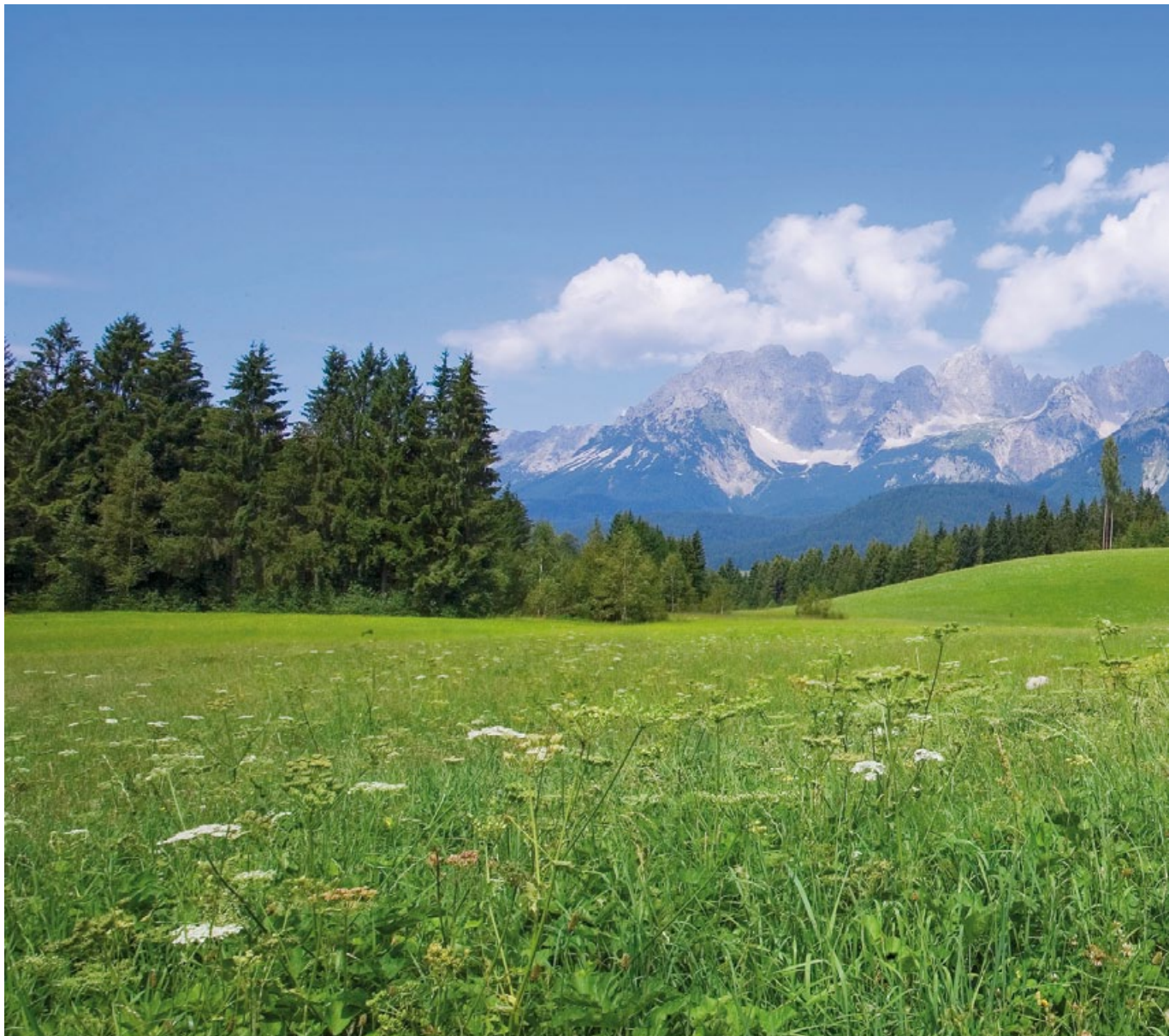
ON THE BACK OF OUR LIPIZZAN-HORSES