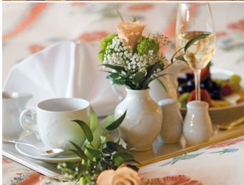
DAHEIM SEIN IN DEN KAISERSUITEN