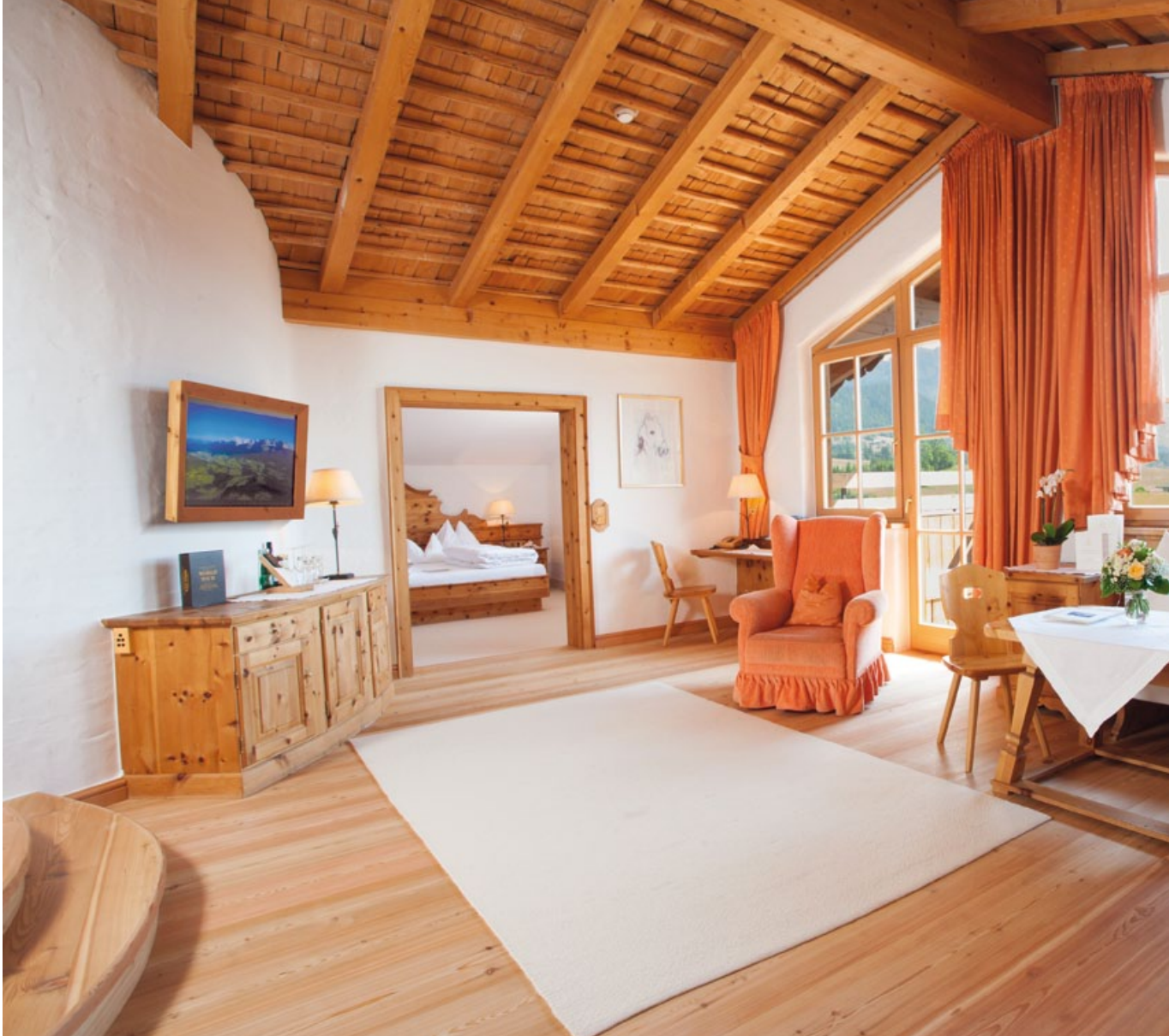
FEELING AT HOME IN THE EMPEROR'S SUITES