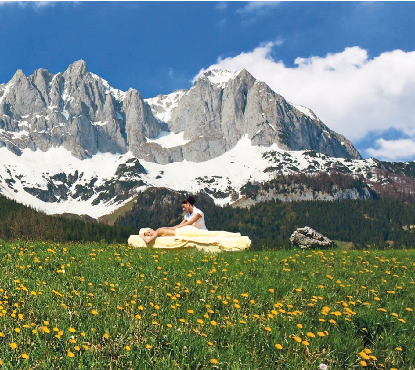
SEELE TANKEN AM FUSSE DES WILDEN KAISERS