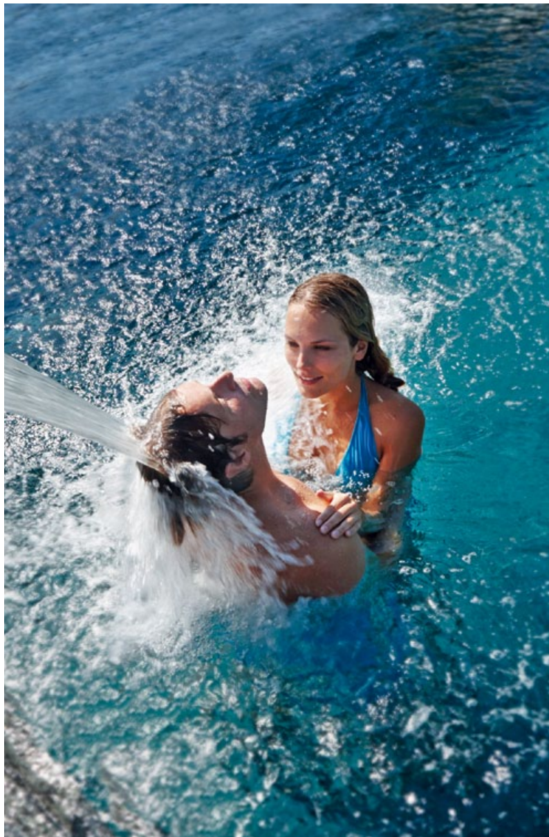
DAS STANGLWIRT-WASSERELIXIER ERLEBEN