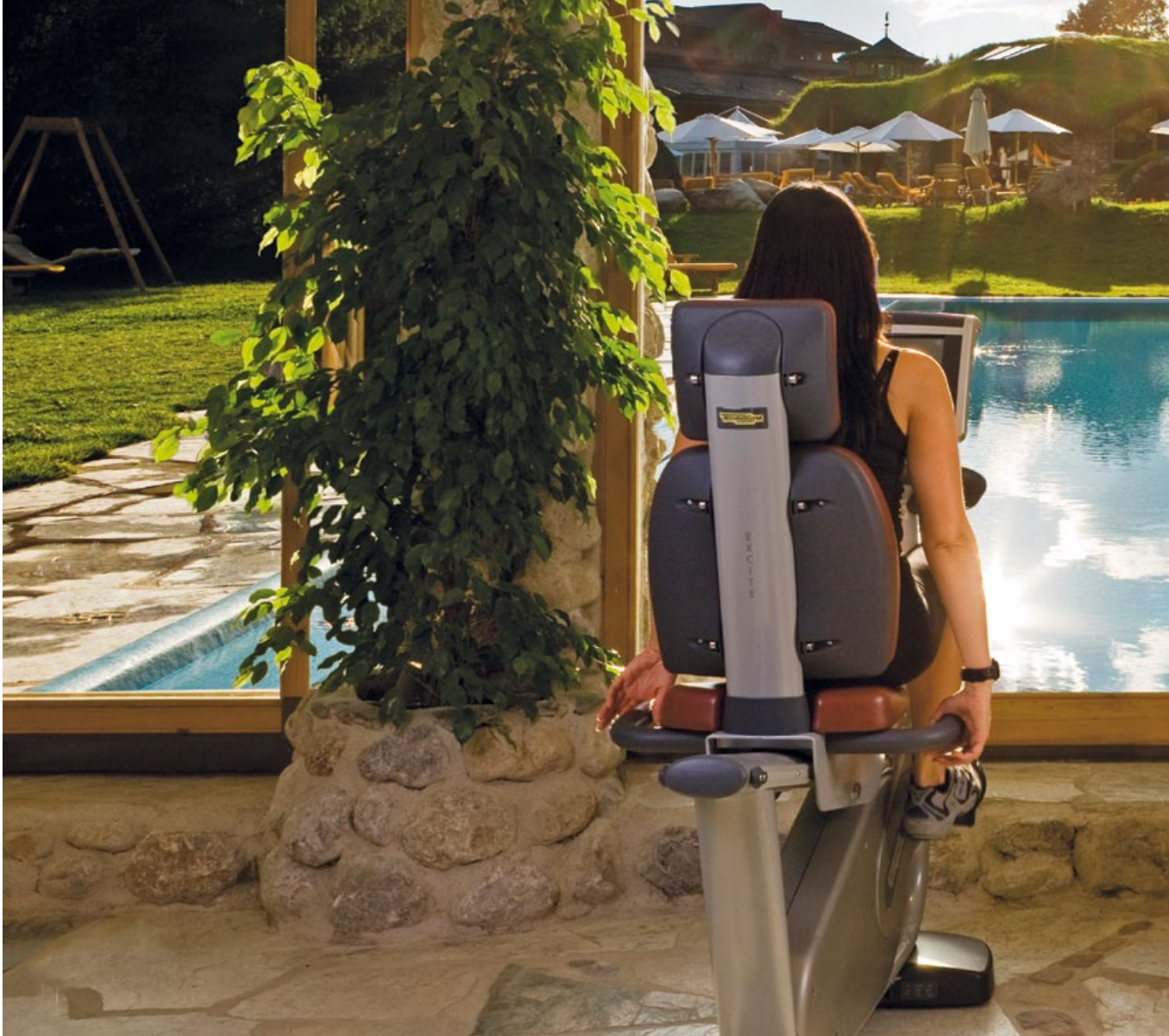
BE ACTIVE IN THE STANGLWIRT'S FITNESSGARDEN