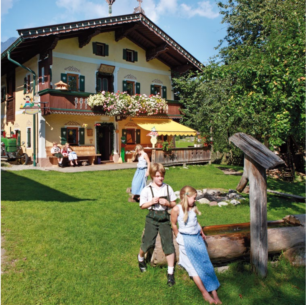
KINDERAugen LEUCHTEN HELL AM STANGLWIRT-KINDERBAUERNHOF