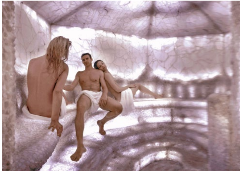
ENTSPANNENDE MOMENTE IN DER FELSEN- UND BERGKRISTALL-SAUNAWELT