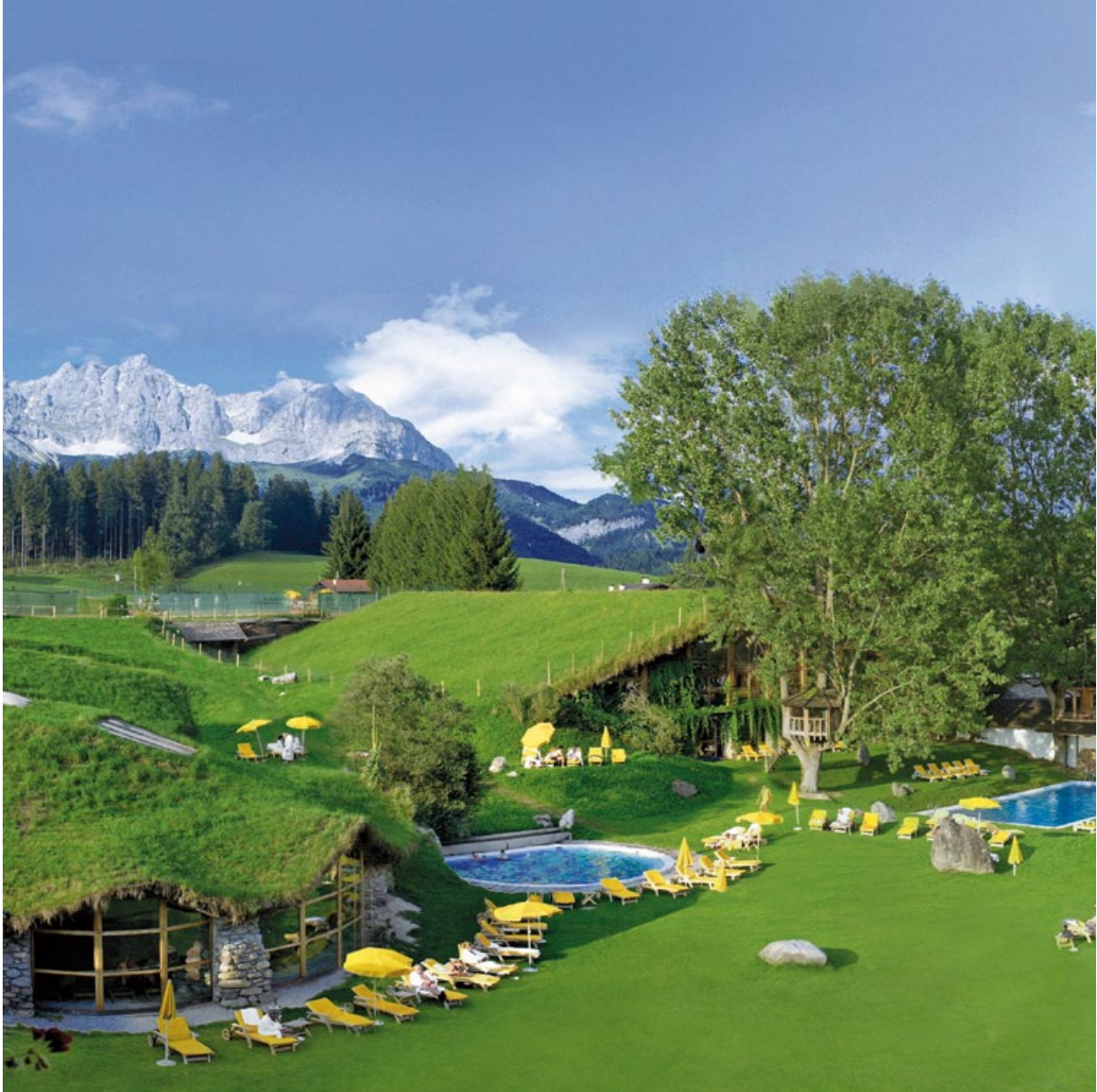
DES KAISERS SCHÖNSTER GARTEN / THE EMPEROR'S MOST BEAUTIFUL GARDEN