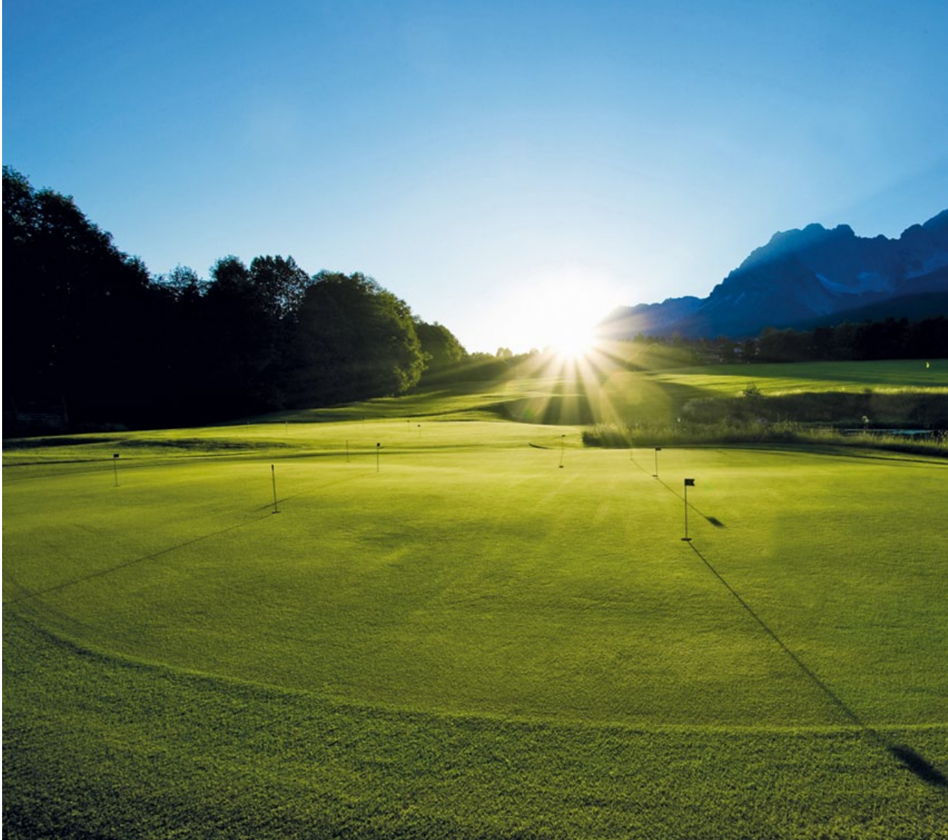
THE EMPEROR'S GOLF-PARADISE