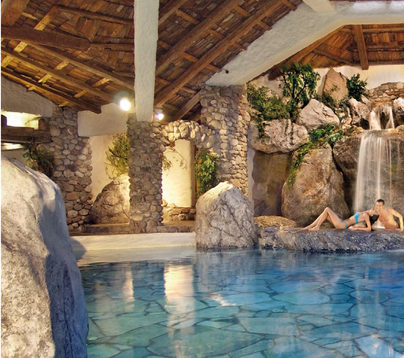
IN THE WORLD OF SENSES