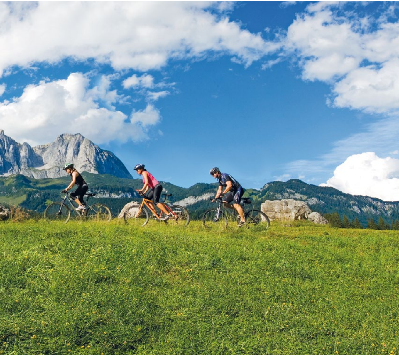
MOUNTAINBIKEN ... DEM HIMMEL SO NAH