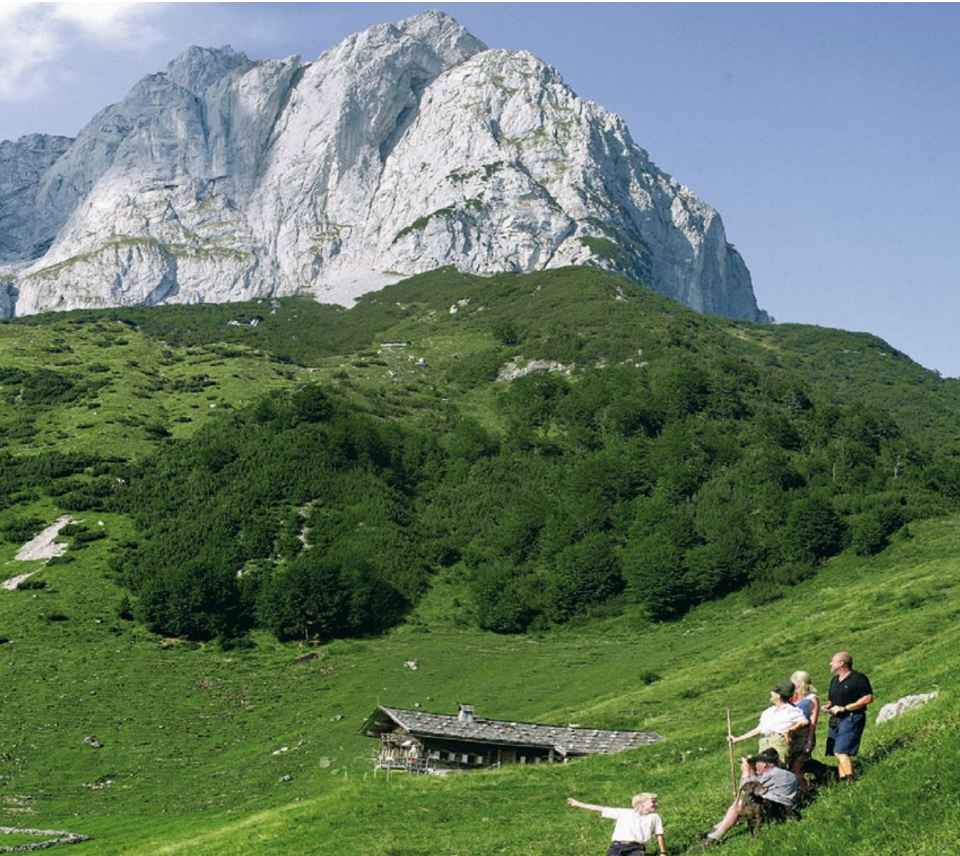
AUF DER STANGL-ALM