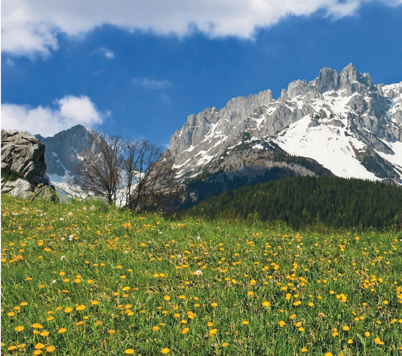
RECHARGE YOUR SOUL AT THE FOOT OF THE WILDER KAISER