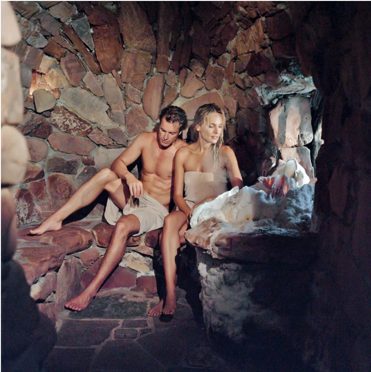
RELAXING MOMENTS IN THE ROCK- AND MOUNTAINCRYSTAL-SAUNAWORLD