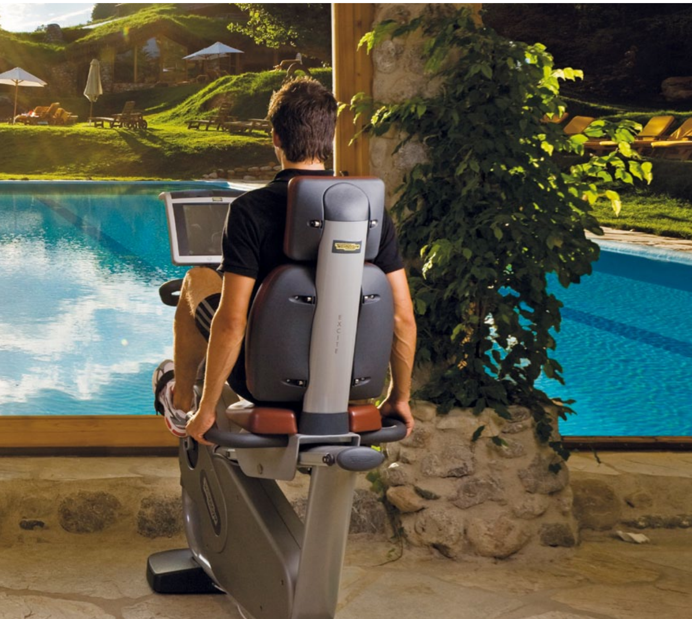
AKTIV SEIN IM STANGLWIRT-FITNESSGARTEN