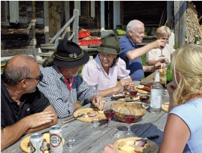
ON THE STANGL-ALM